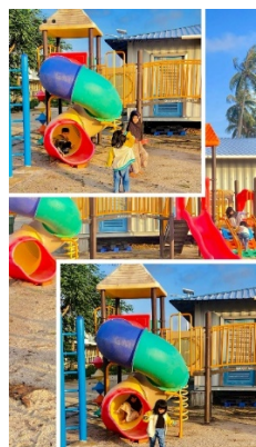
Gambar 3. 4 Postingan Story Instagram

Penulis melakukan kegiatan mempersiapkan bahan untuk diposting ini setiap minggu dua sampai tiga kali tergantung penulis sudah ada bahannya atau penulis mengharuskan untuk datang ketempat yang menjadi bahan penulis untuk posting, penulis juga harus mengambil video berulang kali agar bahan yang di postingkan bagus dan juga mengambil foto yang pas untuk diposting ,dan setiap minggu nya penulis mengambil video dan foto terbaru dan juga ditempat yang berbeda sesuai apa yang mau diposting tema apa aja seperti ada beberapa pengambilan yaitu :