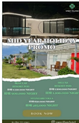
Gambar 3. 3 Promo Instagram

Promosi yang penulis buat ini untuk penulis promosikan di instgram memberitahukan bahwa the saga village hotel resort pod sedang mengadakan promo special.