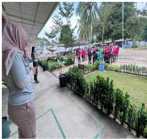
Gambar 3. 2 Rokol Pagi

Rokol adalah kegiatan setiap hari yang harus dilakukan di the saga village hotel resort pod dalam berjalannya kegiatan ini membuat agar karyawan perkerja lebih disiplin dengan waktu, rokol yang dibahas mengenai proses kerja yang sedang berlangsung, informasi ketika ada tamu, apa saja yang harus kita lakukan, membuka pertanyaan untuk karyawan, menanyakan bahan apa saja yang kurang.