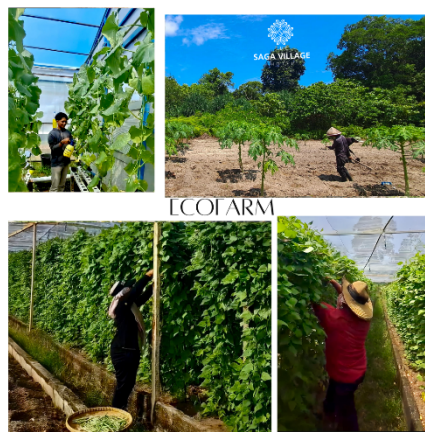
Gambar 3. 6 Postingan