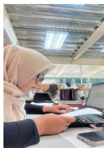
Gambar 3. 8 Mengedit Data Navicon Finance

Mengedit Data Navicon Yang Belum Dimasukkan Ke Dalam Excel Dilakukan Dengan Mengikuti Kode Yang Sudah Ada Sebelumnya. Data Navicon Ini Merupakan Data Perusahaan Yang Mencatat Berbagai Pengeluaran Dana Yang Dibutuhkan Untuk Membeli Keperluan Operasional Perusahaan. Selain Itu, Data Ini Juga Mencakup Pengeditan Data Booking Hotel Yang Dilakukan Melalui Aplikasi Seperti Agoda Maupun Bookingan Yang Dilakukan Secara Offline. Setiap Perubahan Atau Penambahan Data Harus Disesuaikan Dengan Sistem Pengkodean Yang Telah Ditetapkan Agar Tercipta Keceragaman Dan Kemudahan Dalam Pencatatan.