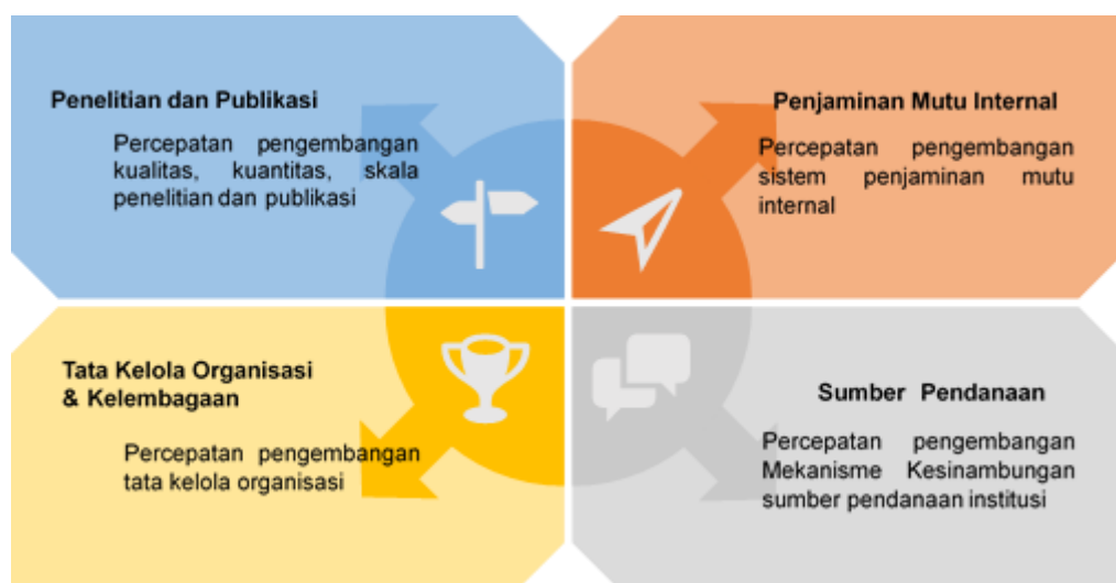
Gambar 4.1. Strategi Utama Prodi D4 Pengelolaan Perhotelan Politeknik Bintan Cakrawala

Adapun rangkuman dari isi tabel di atas dapat disimpulkan pada gambar di bawah ini: