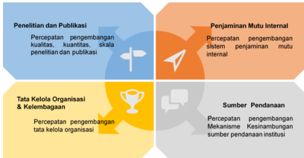
Gambar 3.1. Strategi Utama Prodi D4 Pengelolaan Perhotelan Politeknik Bintang Cakrawala

Adapun rangkuman dari isi tabel di atas dapat disimpulkan pada gambar di bawah ini: