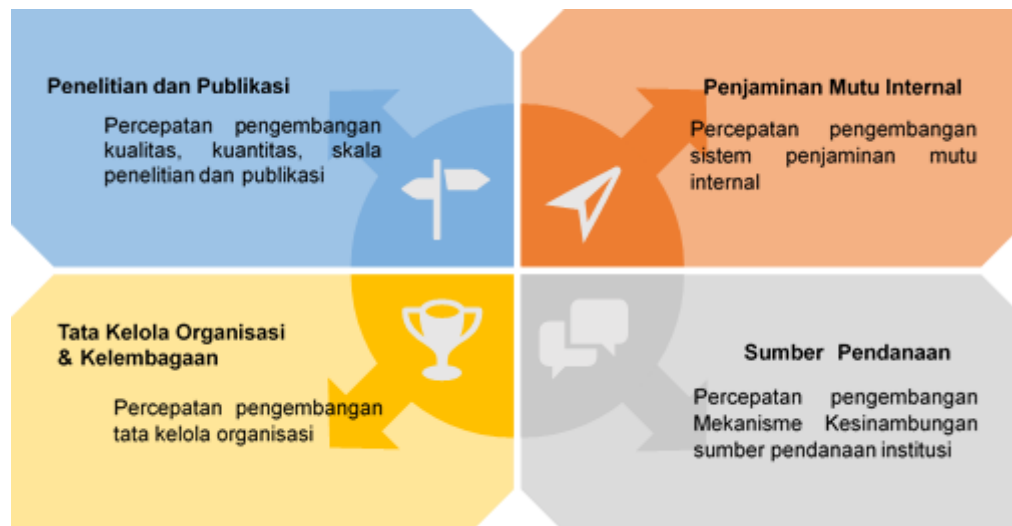
Gambar 4.1. Strategi Utama Prodi D4 Pengelolaan Perhotelan Politeknik Bintang Cakrawala

Adapun rangkuman dari isi tabel di atas dapat disimpulkan pada gambar di bawah ini: